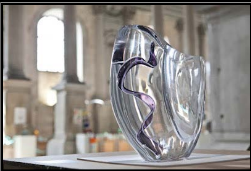
premio murano gioli cenedese