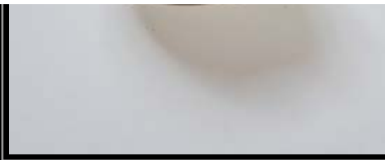
premio matricardi - cenedese