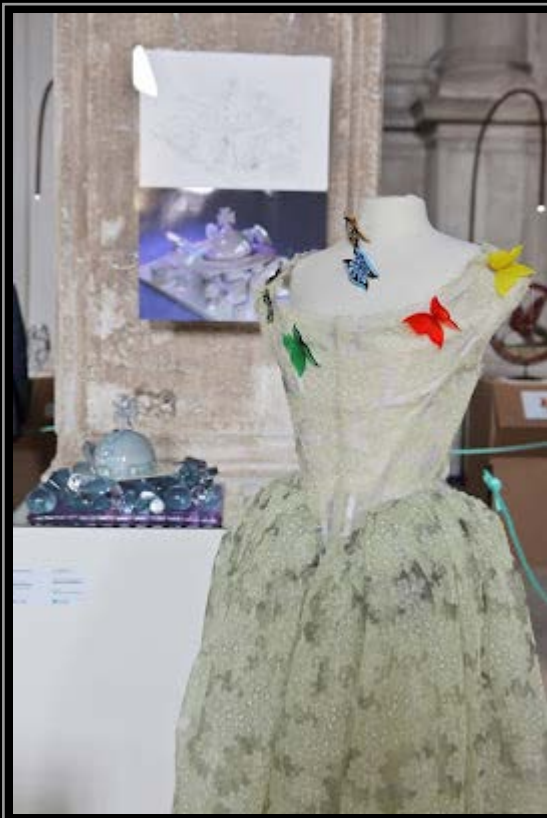
premio murano westwood

Si è concluso con un ex-aequo il Premio Murano 2012, promosso dalla Scuola del Vetro Abate Zanetti di Murano, la cui premiazione si è svolta oggi presso la Scuola della Misericordia a Venezia, gremita da oltre 350 persone tra i quali esponenti del mondo del vetro, artisti e autorità.